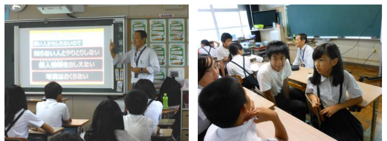
【9/6 スマホ・ケータイ安全教室の様子】

以上のような状況を鑑みて、本年度は5年生と6年生児童を対象に、9月6日の5時間目（5年）と6時間目（6年）にKDDIの方を講師として招聘し、「スマホ・ケータイ安全教室」を実施しました。ラインや動画投稿サイト等の危険性や、正しい使い方について、アニメーションで事例を紹介しながら、わかりやすく教えていただきました。授業後の感想から、スマホを所有している児童、所有していない児童ともに、便利さの裏に潜む危険性について認識を深めていることが窺えました。